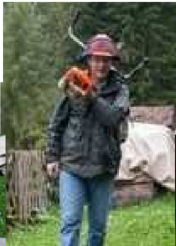
Serait-ce le Dahu ?!