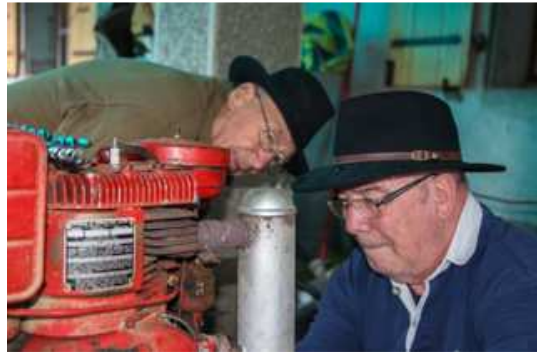
Ca bosse dur !