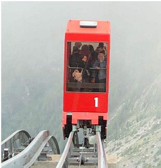
Cabine à ascension vertigineuse... mais c'est déjà mieux que l'ancien système !!!