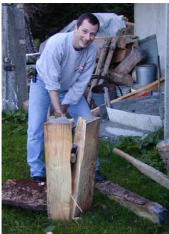
Le terrible combat entre l'homme et la machine. Pendant que les deux ouvriers spécialisés remplissent tranquillement le bûcher à coup de fendeuse pneumatique. Un irréductible « bûcheron à l'ancienne » met les bouchées doubles pour essayer de tenir la cadence infernale... (Michel)