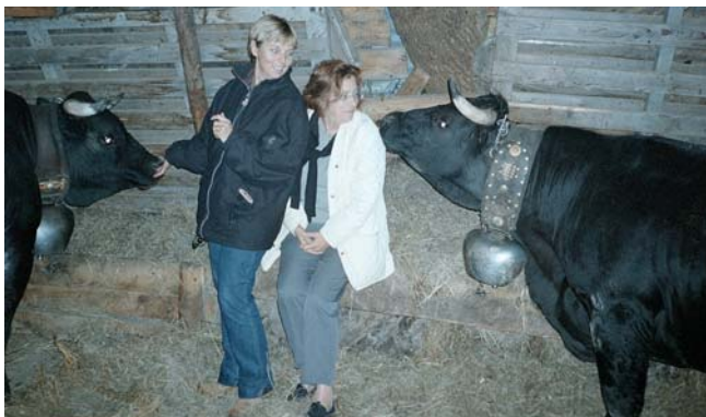
Et voici encore deux magnifiques spécimens !

( Ndlr) Elle est une bonne laitière, même si sa production dépasse rarement les 3.000 kg de lait par an, et son lait est très riche en protéine. Le niveau de 3.000 kg est un maximum, car les éleveurs veulent conserver les qualités combattives de leurs bêtes.