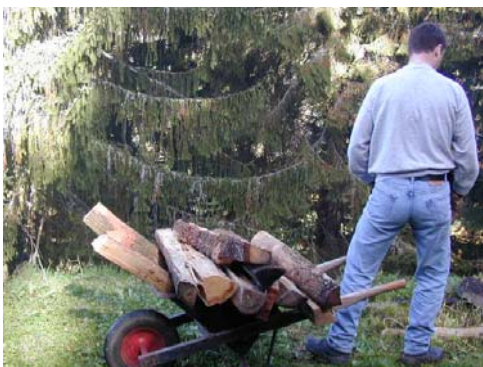
« La chaîne du bois » : étape 1 , le transport