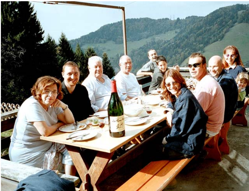
Un dimanche d'été, lors de la dernière corvée d'automne ...