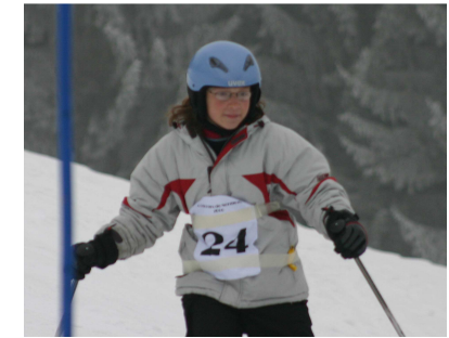
Catégorie star ac :