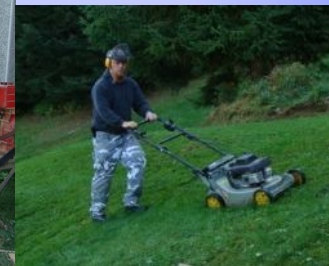
Shampoineuse à gazon