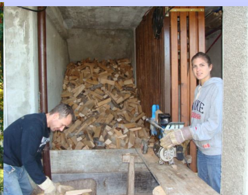
Fabrique de cure-dents pour les genevois !!...