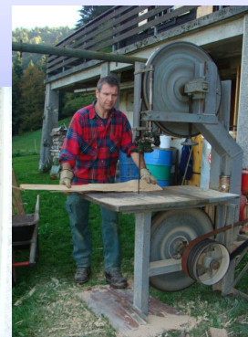
Nouvelle machine à coudre SINGER